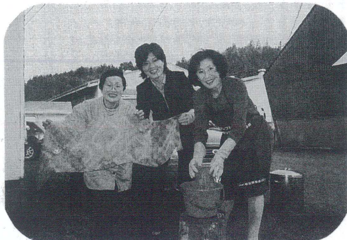
やさしいスカーフの染め上り

あらゆる分野において活動に参画する機会を得、性別による差別を受けずに、能力を発揮する機会が確保されるに至るまでには、私たち一人ひとりが幅広く議論を深め、意識を変えていかなければと思います。