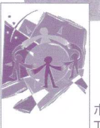
ボランティア Thank youカード