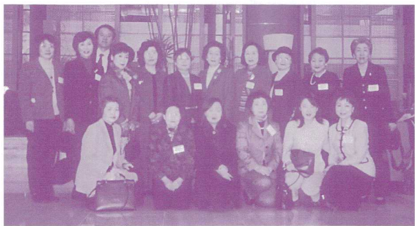
韓国研修参加者 ホテルにて

「海外研修KYOのあけぼの会」は、府が実施した女性海外研修事業の修了生が女性関係団体相互のネットワーク作り及び国際交流を促進することを目的に独自の研修会等の活動を行っております。 この度、当該団体の自主的研修事業として、近隣諸国の中でも、特に官民一体となって女性政策に取り組み、女性の社会進出が急速に進展している韓国を下記のとおり訪問し研修を行って参りました。