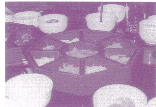
コリアハウスにて王宮料理を楽しみました

コリアハウスにおける王宮料理を始め、彼方、此方で頂いた伝統料理、その都度出されたキムチの味は、それぞれのお店によって、微妙に異なるお味で、一言キムチと言っても、その味の深さに、その店の伝統を感じました。あれも、これも研修させて頂いた思い出はいっぱいありますが、ほんの一つ、感じたことを書かせて頂きました。ありがとうございました。