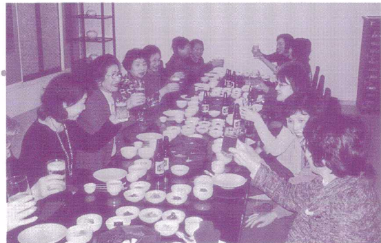
コリアハウスにて夕食 王宮料理にて乾杯