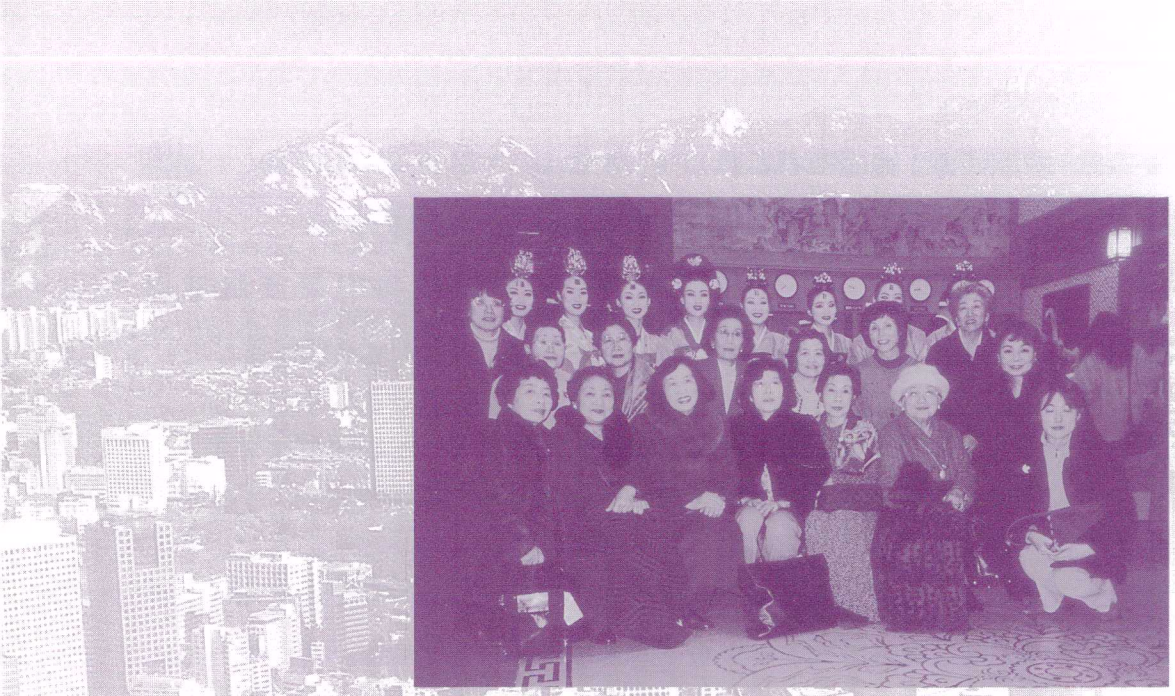
コリアハウスにて韓国伝統舞踊を鑑賞記念に